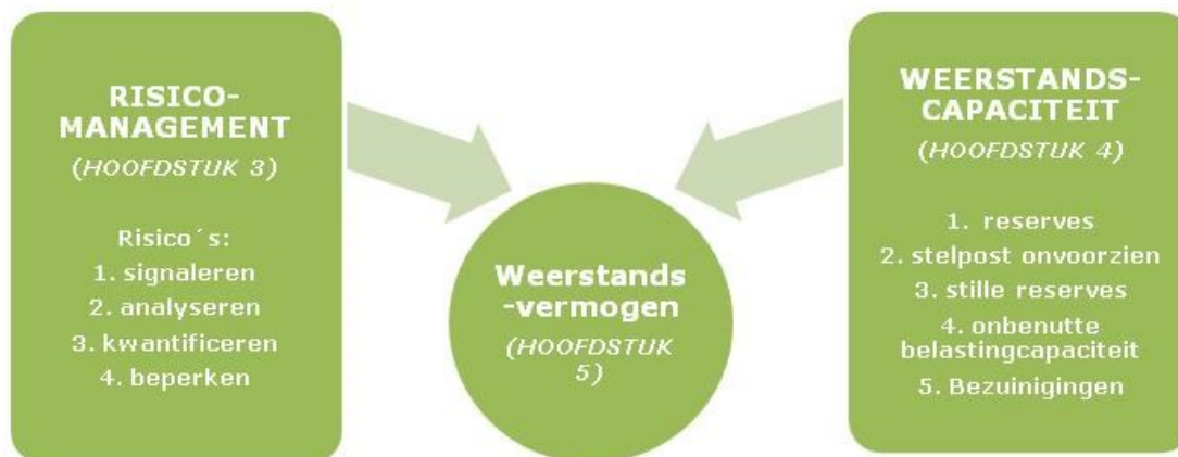
Figuur 1. Relatie begrippen en hoofdstukopbouw

In hoofdstuk 2 presenteren wij het huidige beleid, waaronder visie en doelstellingen, kaders, criteria en begrippen. In de hoofdstukken 3 tot en met 5 wordt achtereenvolgens dieper in gegaan op risicomanagement, weerstandscapaciteit en de relatie tussen risicomanagement en weerstandsvermogen. Tot slot wordt in hoofdstuk 6 een korte samenvatting gegeven. Om de leesbaarheid van deze nota te vergroten, hebben wij de meer inhoudelijke informatie over processen en de weerstandscapaciteit opgenomen in de bijlagen 1 t/m 3.